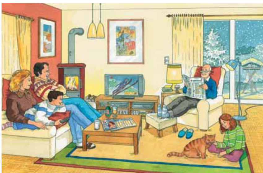
■ Abb. 4: Situationsbild „Im Wohnzimmer“ (Pustlauk & Weng 2008)