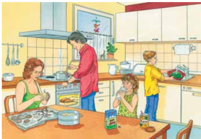
■ Abb. 10: Situationsbild „In der Küche“ (Pustlauk & Weng 2008)