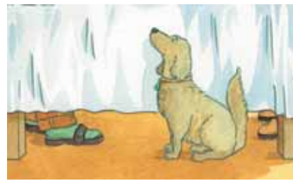
■ Abb 15: Ausschnitte aus dem Situationsbild „Beim Essen“ (Abb. 14)

sich bestimmte simulierte oder authentische Handlungsanlässe. Die einzelnen Teilschritte werden dabei in der Therapie simuliert oder aber für reales Handeln außerhalb der Therapie vorbereitet. Diese freieren kommunikativen Aktivitäten (z.B. einem Text Informationen entnehmen und notieren) ergeben sich im Zusammenhang mit einem Situationsbild und können im Anschluss an die Übungsphasen durchgeführt werden (vgl. Beispiel Abb. 16).