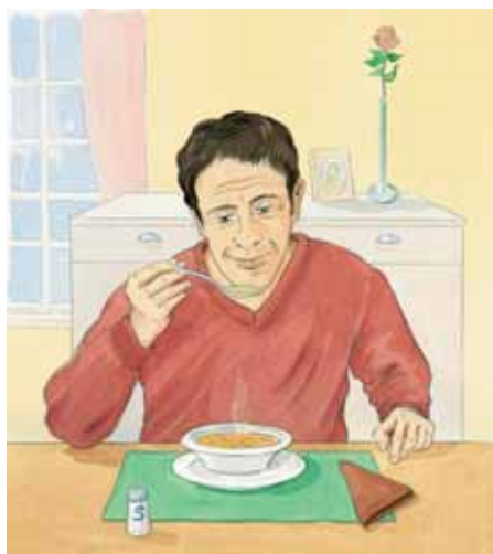
■ Abb. 9: Übungen aus Storch & Weng 2009