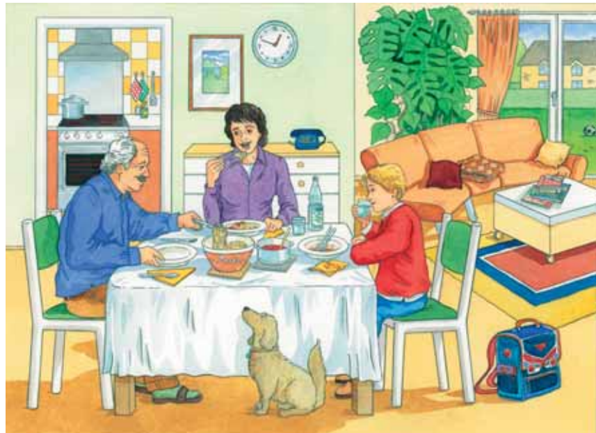
■ Abb. 14: Situationsbild „Beim Essen“ (Pustlauk & Weng 2007)

Situationsbilder beinhalten in der Regel Offenheiten, die Anlässe zum Kommunizieren bieten (Eichheim & Wilms 1981; Storch 1999, 275ff). Bezogen auf Abbildung 14 ergeben sich folgende Fragen bzw. Kommunikationsanlässe: