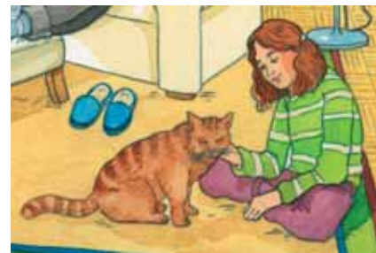
■ Abb. 7: Ausschnitt aus Situationsbild „Im Wohnzimmer“ (Abb. 4)

194ff) und eine möglichst tiefe Verarbeitung und vieldimensionale Vernetzung der Übungsgegenstände ( Storch & Weng 2010 ) erreicht wird. Das geschieht dadurch, dass